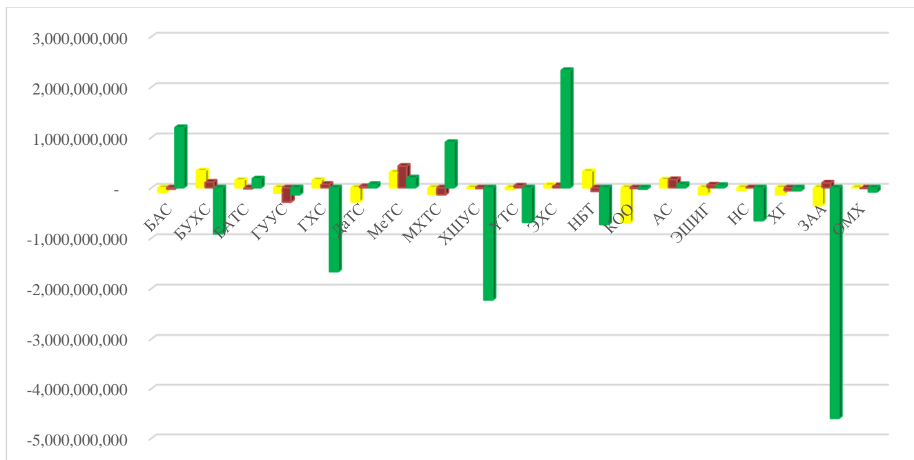
Зураг 5. ШУТИС-ийн 2020 оны бүрэлдэхүүн нэгжүүдийн санхүүгийн үр дүнгийн нэгтгэл

ШУТИСургуулийн бүрэлдэхүүн нэгжүүдийн хувьд төсвийн гүйцэтгэлийн тайлангаар Барилга архитектурын сургууль, Бизнесийн ахисан түвшний сургууль, Дархан-Уул аймаг дахь технологийн сургууль, Механик тээврийн сургууль, Мэдээлэл холбооны технологийн сургууль, Эрчим хүчний сургууль, Ахлах сургууль, Эрдэм шинжилгээ инновацийн газар эерэг буюу орлого зардлын харьцаа хэвийн гарсан бол Бизнесийн удирдлага хүмүүнлэгийн сургууль, Геологи уул уурхайн сургууль, Гадаад хэлний сургууль, Хэрэглээний шинжлэх ухааны сургууль, Үйлдвэрлэлийн технологийн сургууль, Нээлттэй боловсролын төв, Коосен технологийн коллеж, ШУТИС-ий төв номын сан, Хэвлэх газар, Захиргаа, Ой модны судалгаа хөгжлийн хүрээлэн нь хасах үр дүнтэй буюу орлого зарлагын харьцаа алдагдсан байна. Бүрэлдэхүүн нэгжүүдийн санхүүгийн үр дүнгийн үзүүлэлтүүдийг харьцуулан харуулбал: