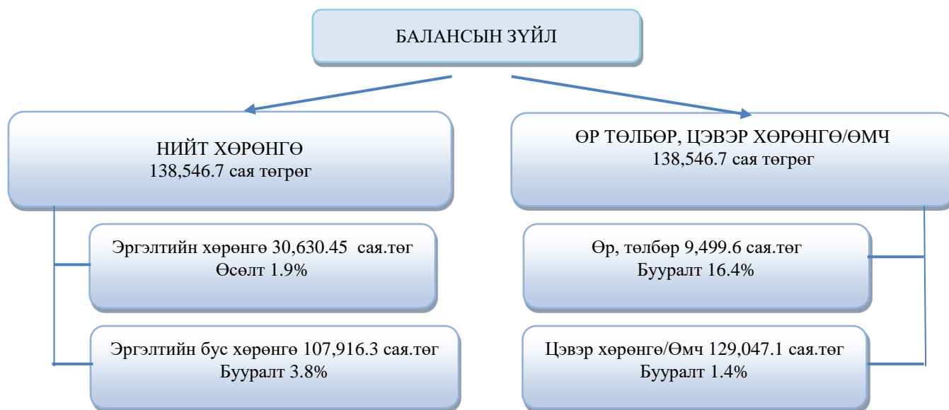
Зураг 2. ШУТИС-ийн 2020 оны балансын бүтэц

Өр төлбөр ба эзний өмч нь богино хугацаат өр төлбөр, урт хугацаат өр төлбөр, засгийн газрын сан, хуримтлагдсан үр дүн, хөрөнгийн дахин үнэлгээний зөрүү зэргээс бүрдэж байна. Богино хугацаат өр төлбөр 1,8 тэрбум төгрөгөөр, урт хугацаат өр төлбөр 4,2 сая төгрөгөөр, засгийн газрын сан 406,8 сая төгрөгөөр, хуримтлагдсан үр дүн 1,4 тэрбум төгрөгөөр, хөрөнгийн дахин үнэлгээний зөрүү 2 сая төгрөгөөр буурсан. Бүтцийн хувьд богино хугацаат өр төлбөр 6,8 хувь, урт хугацаат өр төлбөр 0,04 хувь, засгийн газрын сан 21,9 хувь, хуримтлагдсан үр дүн 27,1 хувь, хөрөнгийн дахин үнэлгээний зөрүү 44,1 хувийг эзлэж байна.