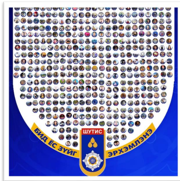
Зураг 4. "БИД ЁС ЗҮЙГ ЭРХЭМЛЭНЭ" (facebook frame) хүрээг ашиглан цахим орчинд нэгдсэн ШУТИС-ийн багш, ажилтнууд

“ШУТИС-ийн багш, ажилтны ёс зүйн өдөрлөг” аянд идэвхтэй хамрагдаж цахимаар нэгдсэн нийт багш, ажилтан та бүхэнд талархал илэрхийлье.