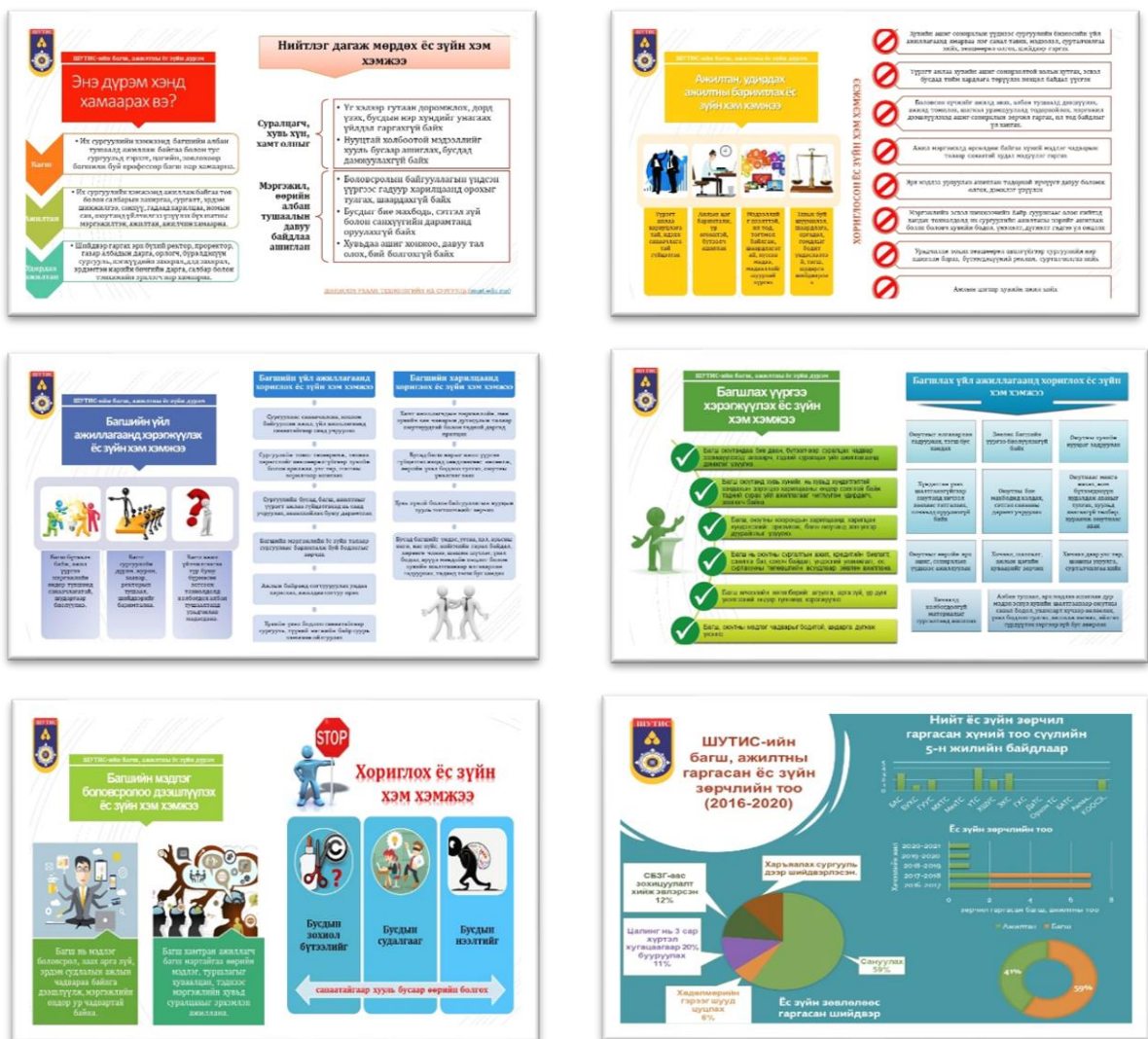
Зураг 1. "ШУТИС-ийн Багш, ажилтны ёс зүйн дүрмийн танилцуулгыг багшийн веб болон бүрэлдэхүүн сургуулийн веб хуудас, фэйсбүүкд байршуулсан баннер