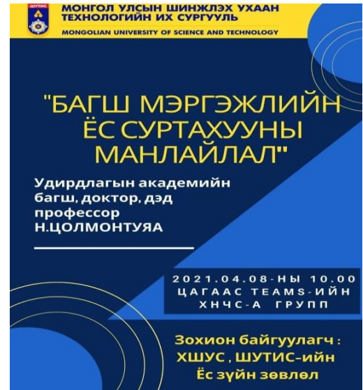
Зураг 3. "Багш мэргэжлийн ёс суртахууны манлайлал" цахим лекц