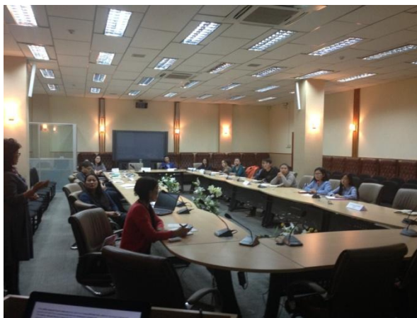
2016.10.14-нд ШУТТНС-д “Дэмжих арга зүй семинар” сургалтанд төслийн оюутнууд оролцов. ШУТИС ЭША, ОХҮА