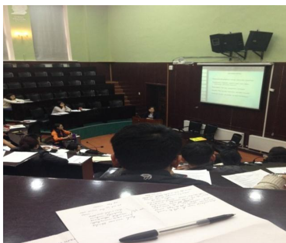
Багийн ахлагч нар 2016.05.11-нд “Төсөл бичих сургалт семинар”-т оролцов. МУИС