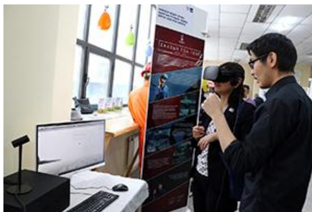
2016.12.22-23-нд “Бүтээлийн үзэсгэлэн”-д төслийн оюутнууд оролцов. ШУТИС, БСШУСЯ, АХБ