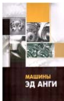
Он: 2009 Хуудас: 330 ISBN: 978-99929-4-437-4