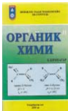
Он: 2010, Хуудас: 502 ISBN: 978-99929-50-05-6